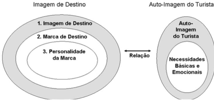
Figura 3 – Imagem de Destino versus Imagem de Marca (Yuksel, 2003)

Também a formação da identidade de uma marca de destino ou serviço foi realçada por Palmer (2004) como um objectivo de marketing comum a qualquer destino. Para Morgan et al. (2004), não é suficiente que tais destinos mostrem a história, cultura e paisagem nos seus esforços de marketing, porque muitos destinos têm estes atributos. O desafio é a sua ligação emocional e social aos turistas e uma identificação clara com os valores daqueles. Outra perspectiva é sugerida por O'Conner et al. (2008), que defendem que um filme pode ser uma ferramenta útil para alterar a IDT, na medida em que captam a atenção das audiências sobre o mesmo, despertando-lhes, assim, o interesse em o visitar. Também Kim e Richardson (2003) alertam para a importância de se compreender melhor a ligação entre filmes e turismo, nomeadamente pelo facto de uma imagem forte constituir uma componente chave da estratégia de marketing dos destinos. Os filmes Senhor dos Anéis (2001-2003) realizado na Nova Zelândia, Chocolat em França (2000) ou Notting Hill em Inglaterra (1999) são bons exemplos de promoção de um destino e de como a sua imagem usada como pano de fundo pode criar e/ou alterar as percepções e imagens de certo destino (Jones e Smith, 2005).