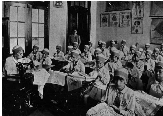
Figura 4 - Uma aula de trabalhos manuais

Deve-se desconfiar dessa fotografia, do seu caráter de imagem posada, caráter presente em praticamente todas as imagens do conjunto. As alunas uniformizadas, concentradas em seu trabalho, enquanto, ao fundo, uma professora vestida elegantemente (o que pode ser percebido através dos adereços por ela utilizados, como o seu colar, e pelas suas roupas, semelhantes às de mulheres que eram retratadas para revistas da sociedade pelotense , da época) as observa. Além da professora, uma aluna uniformizada destaca-se, sentada diante de uma mesa na qual se encontrava a máquina de costurar. Essa aluna provavelmente fosse uma monitora, ou alguém de uma série mais adiantada. A fotografia foi tirada de um ângulo que permite quase que o total enquadramento das alunas. Ao redor, nas paredes da sala, mapas geográficos e pôsteres com explicações de ciências, signos da modernidade pedagógica. Modernidade que, possibilitada pela legenda do Relatório Intendencial, estaria presente em todas as escolas municipais.