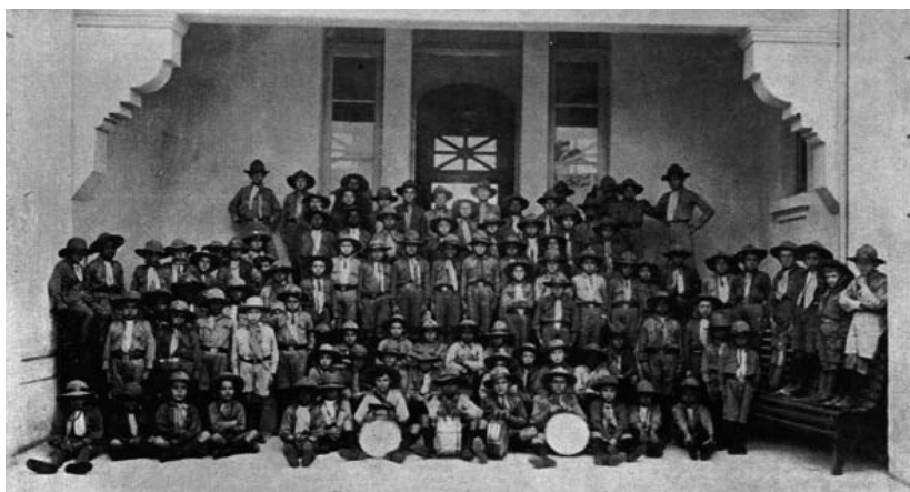
Figura 1 – Grupo de Escoteiros Municipais

Nas primeiras fileiras, alguns dos meninos sentados no chão seguram tambores. Os alunos das fileiras laterais aparecem sentados ou em pé, nos bancos de madeira colocados dos dois lados. Os meninos são, em sua maioria, brancos, porém, verifica-se a presença de alguns negros. No binômio apresentado por Carvalho (1998): educação para o povo e educação para as elites, o ensino primário era aquele que abarcava as camadas populares. Segundo Augusto Simões Lopes, no Relatório Intendencial de 1927: