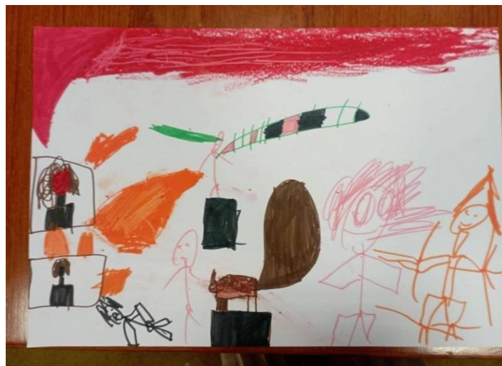
Figura 5 – O fogo no Museu.