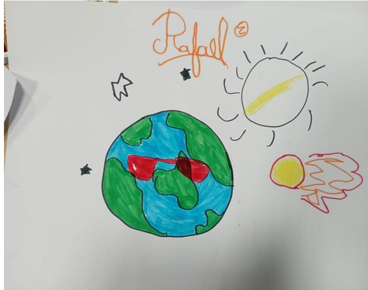
Figura 4 – Um desenho colorido sobre o planeta Terra e um meteorito a chegar.

Seguiu-se ainda um momento de expressão plástica, em que cada aluno pode expressar através do desenho o que mais o impressionou. O fogo no Museu de História Natural do Rio de Janeiro, como o planeta Terra no espaço ou o impacto do Bendegó na Terra foram as cenas mais representadas.