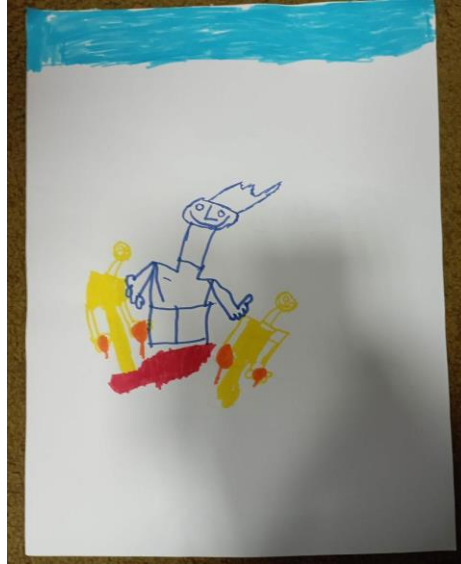
Figura 6 – Desenho de um senhor dançando em torno da pedra.