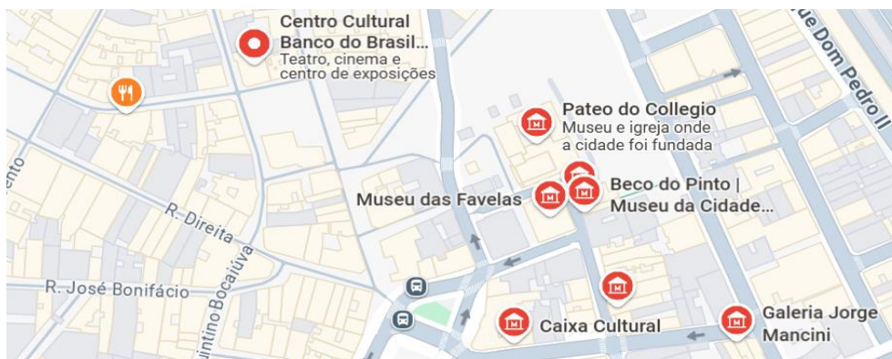
Figura 2: Mapeamento da concentração de museus na região do Centro Histórico de São Paulo. Disponível em: Google Maps. Recuperado em https://www.google.com/maps/search/Museus/@-23.5478024,-46.6343538,17z/data=!4m2!2m1!6e1?entry=tту&g_ep=EgoyMDI1MDYzMC4wKXMDSoASAFQAw%3D%3D

Para além de uma reconfiguração que exige um esforço dispendioso que resulta em desperdícios (financeiros e humanos) para cumprir o processo de reterritorialização 33 , cabe a ponderação sobre o local para onde foi direcionado o museu. Conforme demonstra o mapa acima, trata-se de uma das regiões ainda mais adensadas em termos de instituições culturais e museais do estado de São Paulo. Na retomada de reterritorialização e adequação do discurso para justificativa de ocupação do novo palacete por parte do poder público, se por um lado ocorre uma significativa reafirmação de representatividades substantivas, trazendo em sua exposição de reabertura uma retrospectiva sobre a história do grupo Racionais MC's, um dos mais relevantes e engajados grupos de rap nacional, em contrapartida, o Estado e OSC permitem que o museu seja utilizado como set de filmagem para um documentário tendencioso roteirizado pelo ex secretário de cultura (2020-2022) e atual deputado federal Mário Frias (PL-SP), sobre o ex-presidente Jair Messias Bolsonaro, reconhecido por uma atuação de extermínio de populações periféricas e faveladas no período da pandemia de 2020 34 .