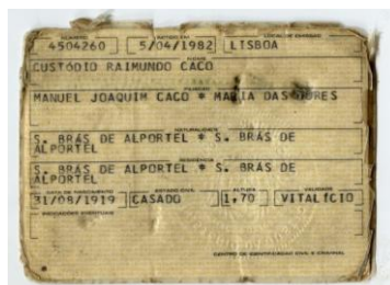
Imagem 13: Último Bilhete de Identidade de Custódio Caco, verso (1982) (inv. cac 1001)