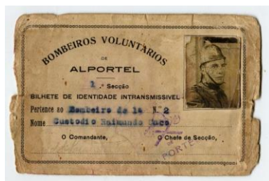
Imagem 12: Cartão de bombeiro voluntário de Custódio Caco, frente (1944) (inv. cac 1006)