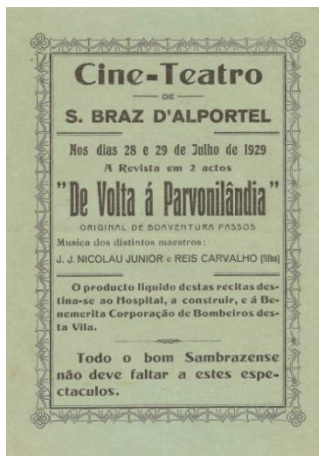
Imagem 4: Folheto original de divulgação da peça de teatro (inv. sba 1139doc)