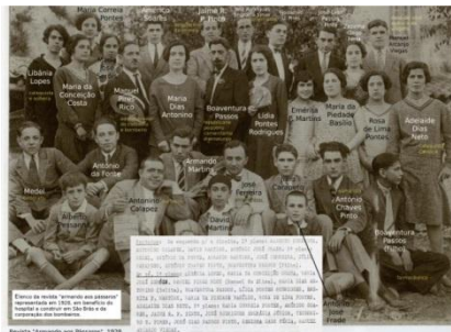
Imagem 2: Elenco da peça teatral “De Volta a Parvonilândia” (1929) (inv. sbv 2056)