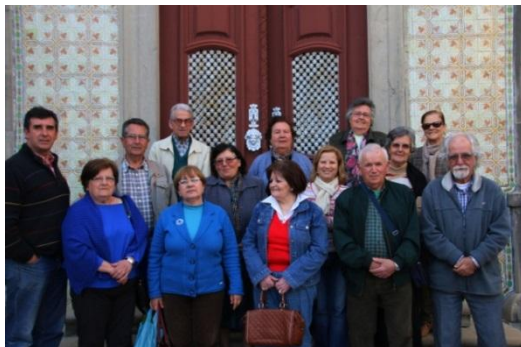
Imagem 1: O Grupo da Fotografia (Abril 2014)