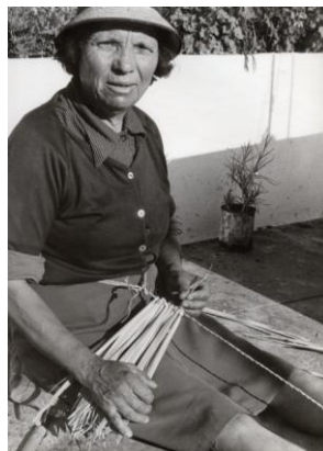
Imagem 15: A artesã explicando o processo de fabricação da vassoura (inv. etn 1039)