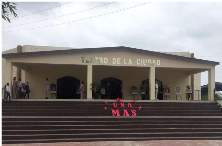
Ilustración 4: Teatro de la ciudad de Gral. Terán

Dany ya que su familia había sido invitada y que la exposición terminará con la ilustración de Isabel que en ese momento era el feminicidio más reciente ilustrado.