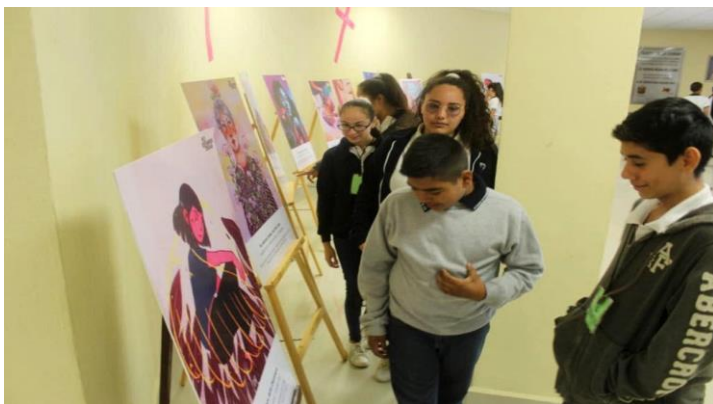
Ilustración 5: Estudiantes en la exposición, Gral. Terán

Curso: las ilustraciones estaban por todas partes, después de la conferencia hubo un refrigerio y se dejó el espacio abierto para que las personas pudieran navegar libremente y contemplar los paneles, el tiempo y el trayecto que siguieran quedaba a su elección.