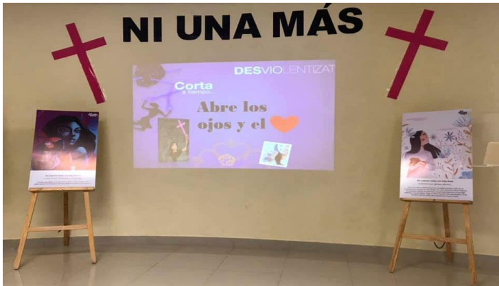
Ilustración 6: Presentación Abre los ojos y el corazón

el COVID-19 las fechas en que estas acciones sucederán están pendientes.