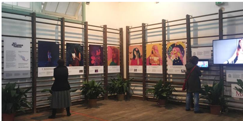
Ilustración 3: Exposición Lisboa

Esta exposición es una protesta colectiva de distintas artistas visuales, defensoras de derechos humanos, víctimas de violencia y personas cercanas a la causa varias para denunciar feminicidios y transfeminicidios, explica también las formas en que cruelmente son retratados.