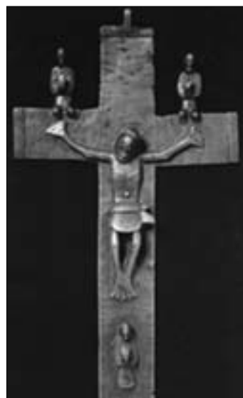
Crucifixo, em latão Kongo, séc. XVII. Museu Berlim

Embora a minha abordagem tenha evitado tomar a realidade como homogênea, uniforme e coerente, quando tratamos das cosmologias africanas sempre corremos o risco de reproduzir a visão caricata dos missionários e comerciantes a respeito do africano, já que são deles os escritos de época.