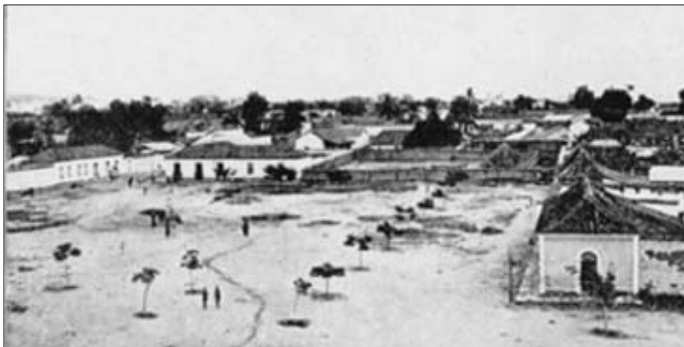
BENGUELA – Vista parcial da cidade

Era tamanho o temor pelos brancos que vagavam pelo interior, entre degredados, aventureiros, desertores que o governador Sousa Coutinho chegou a comentar que «... aqui não receberão os conquistados os costumes dos conquistadores, antes muito pelo contrario, estes se apropriarão... (d)o gentilismo, e (d)a superstição» 27 . Mesmo as povoações no final do século ficaram abandonadas, por conta dos capitães-mores.