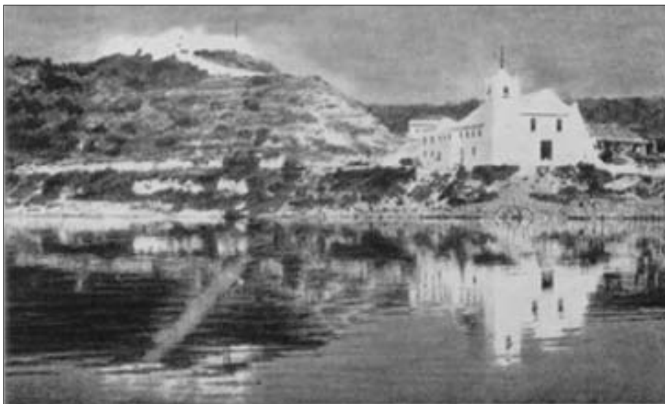
Fortaleza da Muxima e a Igreja

Ao longo do rio Cuanza, via principal para a região central de Angola, localiza-se a fortaleza de Muxima, fundada no século XVI, distante de Luanda 135 km 63 . A fortaleza recebeu este nome por situar-se nas terras do soba (soberano local) Muxima Aquitamgombe. Os portugueses construíram próxima à fortaleza uma igreja chamada Imaculada Conceição 64 e desde o início do século XVII existem as histórias dos mila-