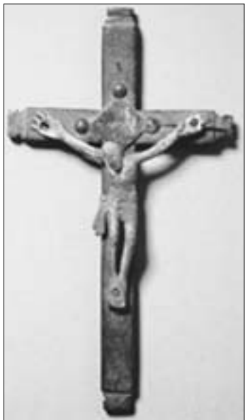
Crucifixo, em liga de cobre Kongo, séc. XVII. Museu Berlim

participação de danças e cantos africanos 77 . Embora exista com frequência um discurso contra as práticas médicas africanas, o recurso aos seus préstimos era sempre recorrente.