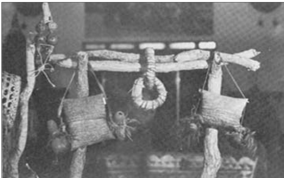
Bolsas de Magia

Areia, M. L. Rodrigues de, Les Symboles Divinatoires , Coimbra, Inst. Antropologia/Universidade de Coimbra, 1985.