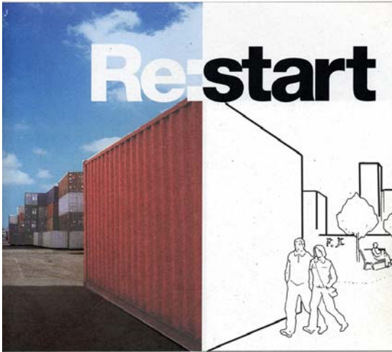
Figura 3 - Material de marketing produzido pela Parque Expo S. A. em 2003. Os contentores foram os objectos escolhidos para explicar graficamente o conceito de «terreno deixado vago» em que o processo de transformação foi baseado. O texto publicitário anuncia que a referida sociedade deu início ao maior desafio em estratégia ambiental e desenvolvimento urbano em Portugal, transformando uma zona degradada num recinto adequado a uma exposição mundial.