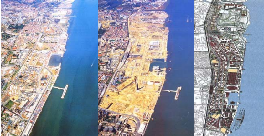
Figuras 4a, 4b e 4c - Vista aérea da zona da Expo antes da demolição das instalações industriais (imagem da esquerda), durante a construção para a Expo '98 (imagem ao centro) e o desenho do projecto urbano (imagem da direita).

Nenhum empreendimento imobiliário omite o valor do terreno quando calcula o investimento. No Parque Expo a venda dos terrenos urbanos para urbanizar tornaram-se uma importante fonte de receitas (51%) para as entidades públicas envolvidas no processo, já que, na maioria dos casos, estas não dispunham de meios financeiros para concretizar projectos de grande envergadura.