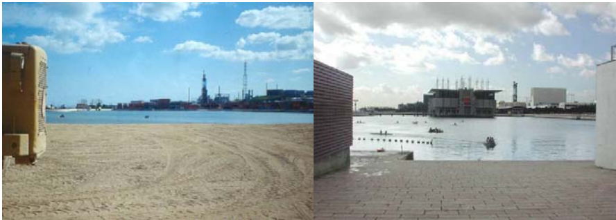
Figuras 2a e 2b - Vista do lado norte do porto, antes (imagem da esquerda) e depois (imagem da direita) da intervenção urbana na zona da Expo '98.