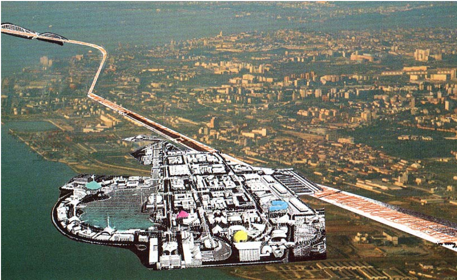
Figura 1 - Colagem do projecto da Expo '92 (realizada em Sevilha) sobre uma área da frente ribeirinha de Lisboa (1990).

A reconversão da frente ribeirinha na zona da Expo é a maior transformação envolvendo a cidade e o porto ocorrida em Portugal. O recinto foi inaugurado para a Exposição de 1998 e a operação urbanística é concluída dez anos depois. Constitui uma solução já testada sobre a qual importa reflectir e debater. No todo é um processo muito complexo pelo que procuramos aqui analisar separadamente alguns dos seus aspectos de maneira a tornar mais fácil interpretar a informação disponível.