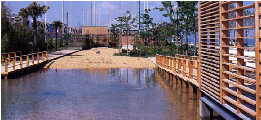
Figura 9 - Vista do Jardim Garcia de Orta de J. Gomes da Silva, L. Cheis, R. Salema, J. Adrião e I. Norton (1998); cinco rectângulos representam os ecossistemas de Macau, Goa, S. Tomé, Açores, e África.

O processo da reconversão da zona da Expo '98 iniciou-se a partir do conceito de terrain vague que preconiza a eliminação de vestígios do passado, e isto dá origem a uma lacuna na memória das gerações vindouras. A reabilitação que combina presenças precedentes e novas não só mantém os laços entre as gerações anteriores e actuais, como também contribui para preservar marcas de identidade dando-lhes continuidade no futuro.