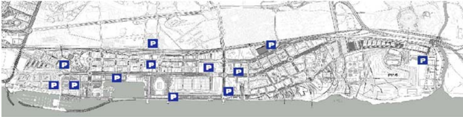
Figura 5 - Vista geral do plano urbano do Parque Expo, com a localização das áreas de estacionamento.

Os amplos espaços abertos dessa área geram uma nova centralidade para a cidade, abundante em funções, que tenta re-interpretar a antiga imagem de «coração da cidade». Todavia, o recinto da Expo não pode preencher a função de um local de encontro, na verdadeira e completa acepção do termo, função essa que ainda permanece viva nas áreas da frente ribeirinha/marítima adjacentes aos centros históricos das cidades.