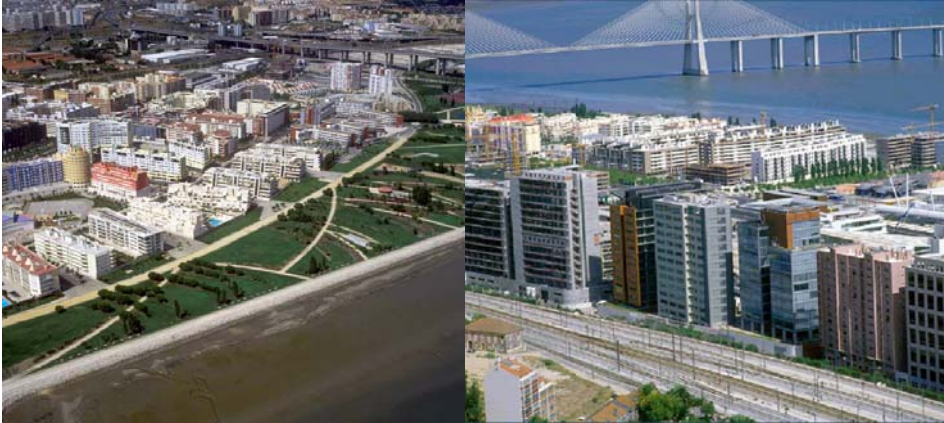
Figuras 7 e 8 - Vista aérea da Vila Expo, Zona Norte – PP4 da autoria de Cabral de Mello e M.M. Godinho de Almeida. O projecto de arquitectura paisagista é de João Nunes e Hargreaves Associates (a Hargreaves produziu igualmente o projecto do Crissy Park de São Francisco); Vista do empreendimento urbanístico a sudeste do local da Expo '98, fotografados em 2003.