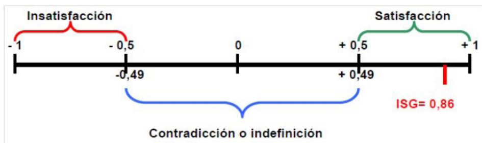
Figura 3: Ubicación del Índice de Satisfacción Grupal con el Proceso aplicado.

La aplicación de la encuesta, aportó otros resultados que contribuyeron a complementar la información y ratificaron la satisfacción de los encuestados con del Proceso de evaluación y caracterización del comportamiento aplicado, que en resumen, permitieron constatar la aceptación de la propuesta.