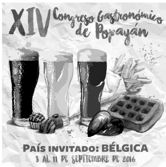
Figura 3. Póster Congreso Gastronómico de Popayán.

Su evento central es el Congreso Gastronómico de Popayán. La Corporación hace presencia en Facebook, Twitter y en YouTube. Sus contenidos publicados se concentran en la información referente al Congreso, sus retos, presentaciones y concursos. El Congreso es, quizás, el evento cultural que más ha crecido y mejor se ha consolidado en la ciudad en los últimos lustros. Cada año, hay un país y una región (nacional) como invitados especiales. El Congreso tiene una agenda académica y otra dedicada a la degustación de gran variedad de platos.