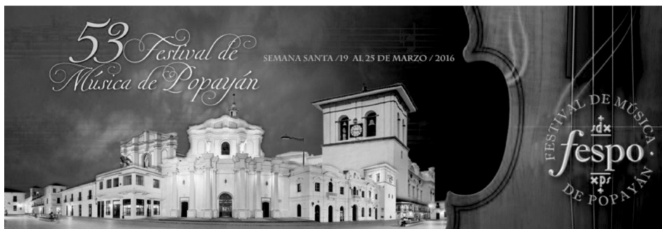
Figura 2. Póster Festival de Música Religiosa de Popayán.