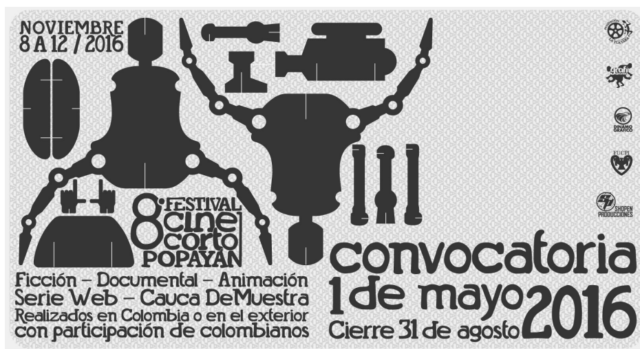
Figura 4. Póster Festival de Cine Corto de Popayán.

Nace en el año 2009. El evento anual es organizado por la Corporación Cinematográfica del Cauca. Con presencia en su página web y Facebook, el objetivo es lograr un reconocimiento en la escena cinematográfica nacional. El Festival ha mantenido un buen nivel en la muestra que finalmente se exhibe al público gracias a una importante labor de curaduría audiovisual. Además de la exhibición del material audiovisual, el Festival también programa charlas y talleres con los realizadores asistentes e invitados especiales.