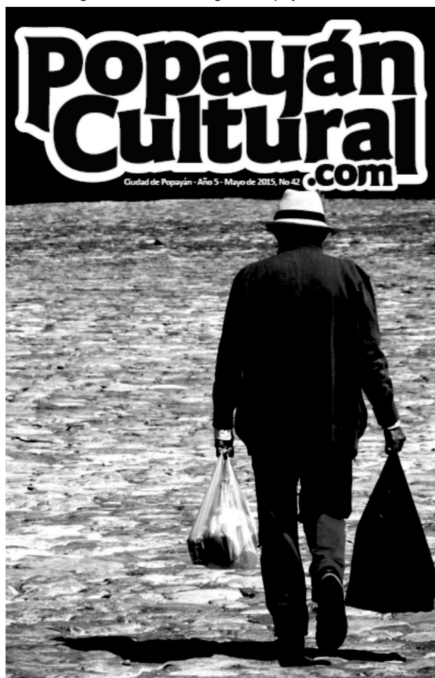
Figura 1. Portada magazín Popayán Cultural.

Es una propuesta cultural con un enfoque básicamente informativo. Tiene página web, Facebook e Instagram. Promociona la mayoría de eventos culturales y académicos que se realizan en la ciudad. Publica información de otros medios, temas locales o nacionales que traten el tema cultural o artístico. La organización ha ganado y consolidado un espacio como vitrina de difusión cultural de la ciudad. Su medio más conocido es un magazín que circula gratuitamente entre la ciudadanía y en él se presenta regularmente la agenda cultural que se oferta para la ciudad.