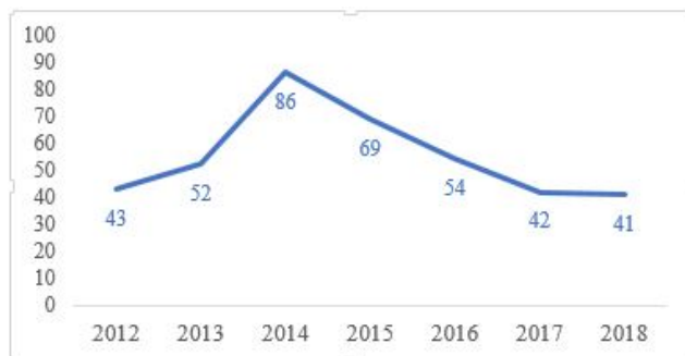
Gráfico 3. Número de artigos publicados entre 2012 e 2018.

Proseguimos a análise da produção científica, procurando identificar a sua distribuição cronológica. É em 2014 (com 22,2% dos artigos publicados) que se dá maior atenção a estas questões, decrescendo um pouco no ano seguinte (17,8%) e posteriores (Gráfico 3). Com efeito, em 2017 e 2018 o número de artigos publicados fica abaixo dos registados em 2012, parecendo indiciar quer um esmorecimento do interesse dos investigadores pelas questões da pedagogia do ES, quer uma mudança nas políticas editoriais, que darão primazia a trabalhos sobre outras temáticas.