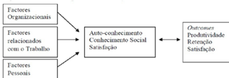
Figura 1. Modelo Conceptual 1 da satisfação no trabalho dos académicos